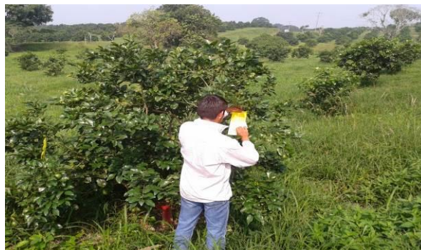
Figura 2. Revisión de trampas durante el monitoreo del PAC.

Dichas trampas se revisan cada catorce días y se analiza la información en el Sistema de Monitoreo de Diaphorina (SIMDIA), lo anterior para la toma de decisiones de acuerdo al umbral de acción determinado por el Grupo Técnico del Estado.